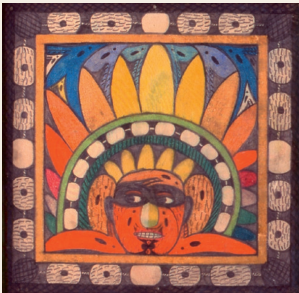
Adolf Wölfli, Selbstdarstellung , ca. 1915-1930, kleurpotlood en grijs potlood op papier. Privécollectie, Museum Dr. Guislain, Gent